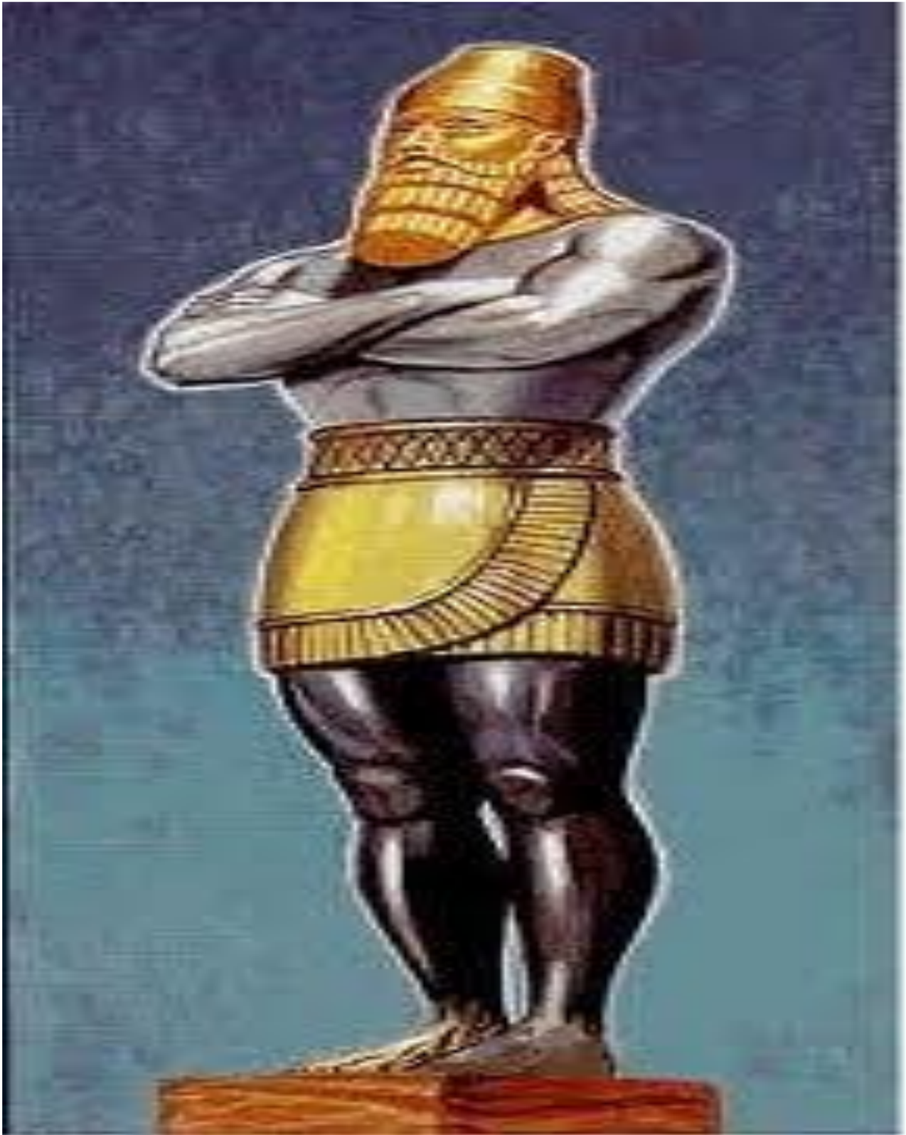
Cecil N. Wright na okyerεwee